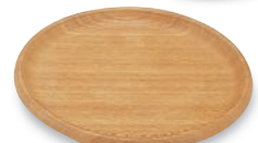
PS-481 丸プレート 140φ×18(内130φ) ¥2,000