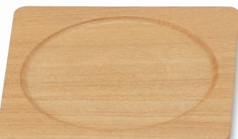
PS-207 角プレート(大) 205×205×13(内175φ) ¥2,900