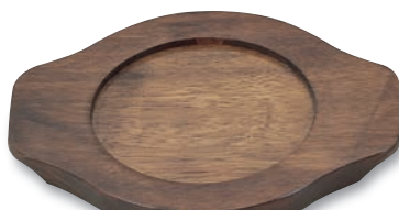
PS-214 石鍋用木台 240×190×20(内135φ) ¥2,600