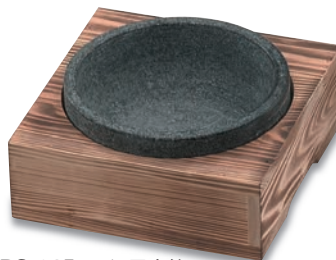
PS-215 石鍋用木箱 220×220×75(穴径185φ) ¥5,500