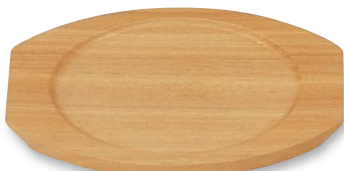
PS-210 小判プレート(大) 235×205×13(内175φ) ¥2,900