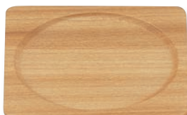
PS-208 角プレート(中) 165×165×13(内145φ) ¥2,200