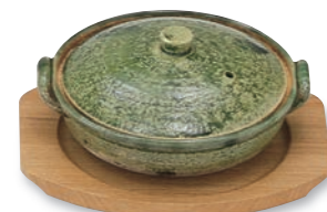
PS-212 小判プレート(小) 195×165×13(内145φ) ¥2,000