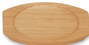
PS-211 小判プレート(中) 205×175×13(内155φ) ¥2,400