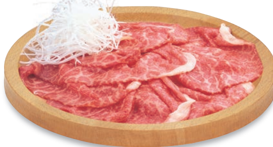
BR-402 ミートプレート(中) 270φ×25(内240φ) ¥5,800