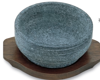
PS-213 石鍋用木台 240×190×20(内155φ) ¥2,600