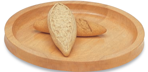
BR-403 ミートプレート(小) 230φ×25(内200φ) ¥4,700