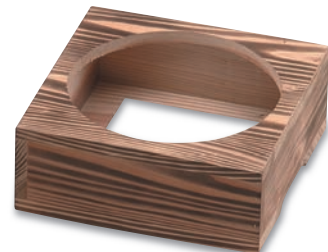
PS-216 石鍋用木箱 220×220×75(穴径185φ) (耐火ボード付 160×160×6) ¥6,200