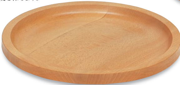
BR-401 ミートプレート(大) 310φ×25(内280φ) ¥7,300

しゃぶしゃぶなどの肉メニューにぴったり。 熱を伝えにくい木の特性を活かし、 肉の鮮度を保ちます。