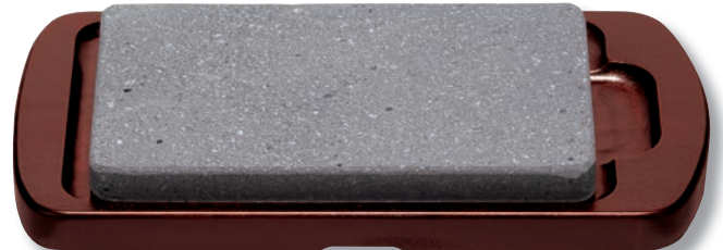
SA-42 石焼ステーキセット(小) 310×185×35 ¥13,600