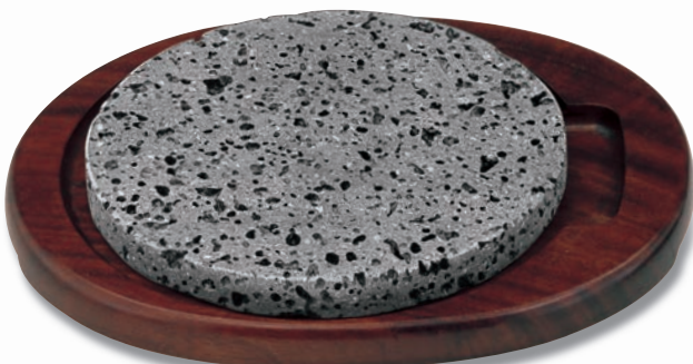
SA-46 石焼ステーキセット 280×230×35 ¥18,900