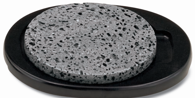
SA-43 石焼ステーキセット 280×230×35 ¥18,900