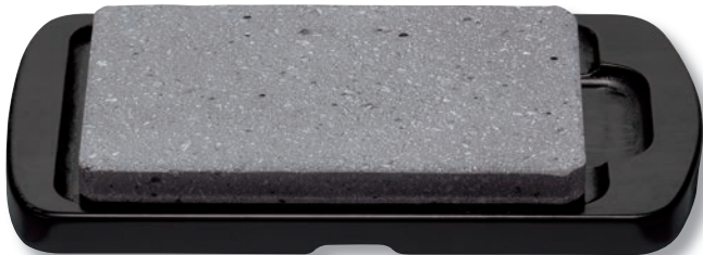
SA-45 石焼ステーキセット(小) 310×185×35 ¥13,600