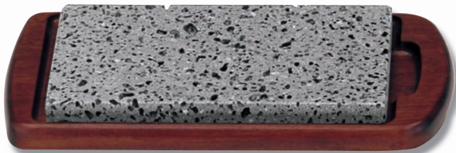
SA-44 石焼ステーキセット(大) 340×185×35 ¥16,600