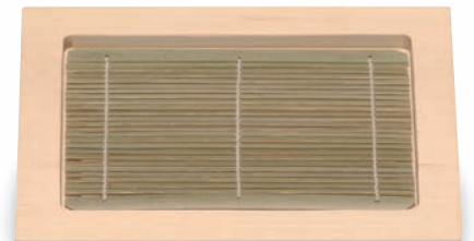
NB-206 そば皿(小) 230×180×20(内183×132×10) ¥7,700