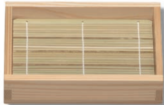
NB-202 長角そば 205×150×40 (内180×130×30) ¥5,000