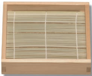
NB-203 正角そば 195×195×40 (内175×175×30) ¥5,100