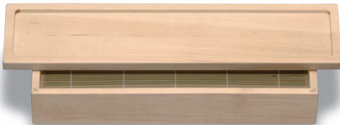
NB-204 箱そばセット 380×135×65 ¥15,500 ●本体(NB-204M)320×135×55(内300×115×30) ¥8,600 ●盛皿(NB-204F)380×100×20(内360×80×3) ¥5,300 ●竹ス(NB-204T)298×113 ¥1,600