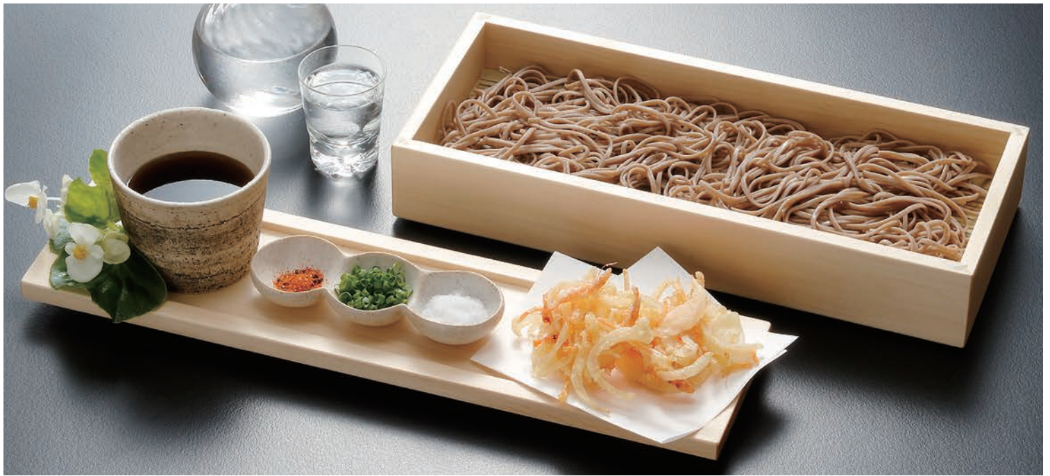
材質:ひのき しな ウレタン塗装