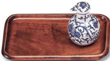
SB-203 角皿(小) 220×145×20 ¥2,200