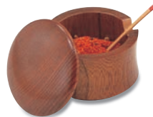
SB-708 薬味入 70φ×50 ¥3,800