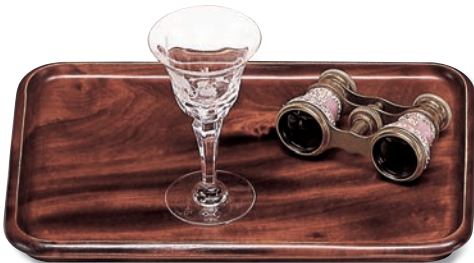
SB-202 角皿(中) 285×190×20 ¥3,900