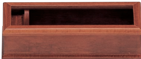
SB-604 箸箱 290×100×75(内230) ¥7,800