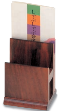
SB-711 メニュー&ナフキン 100×95×140(内15) ¥4,500