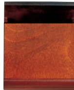
SB-704 ナフキン 100×75×100 ¥2,900