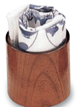
SB-707 フキン立 70φ×70 ¥2,500