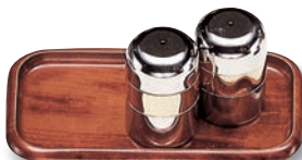
SB-607 カスター(小) 150×80×15 ¥1,500