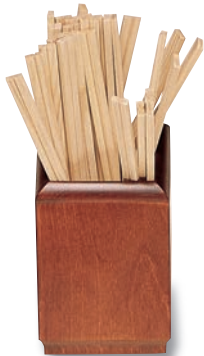
SB-602 箸立(小) 85×85×130 ¥2,900