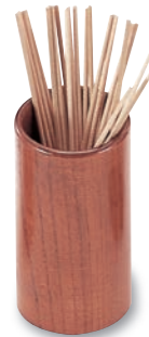
SB-712 串立(大) 60φ×115 ¥2,700