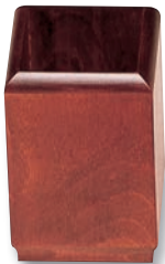
SB-601 箸立(大) 95×95×140 ¥3,000