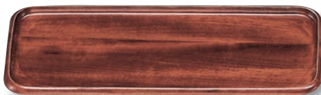
SB-605 カスター(大) 260×110×15 ¥2,100